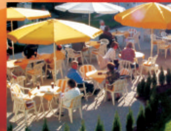
Gastlichkeit im Biergarten und Restaurant

Somit können Sie im Kaiser Trajan „ganz ohne Reue“ kalorienarme Naturküche ebenso wie cholesterinbewusste oder auch vegetarische Gerichte genießen.