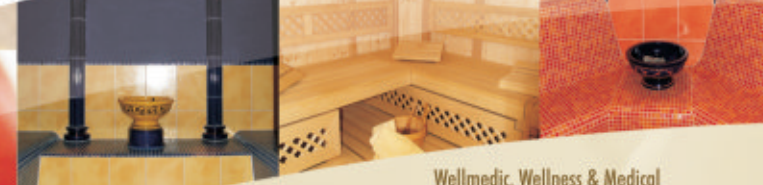
Wellmedic, Wellness & Medical